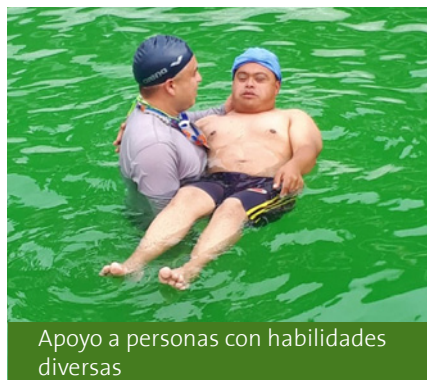
Apoyo a personas con habilidades diversas

“Esas alianzas con Holcim han permitido desarrollar proyectos, e incentivar a la comunidad y a la misma administración para colaborar y maximizar el presupuesto del municipio”, concluye. 🇨🇴