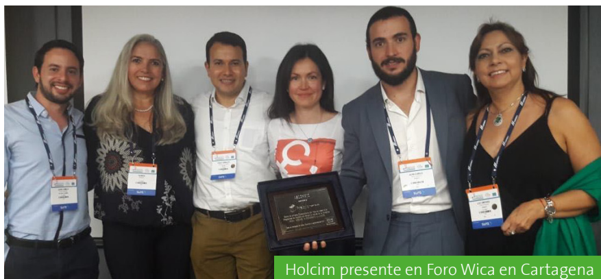
Holcim presente en Foro Wica en Cartagena