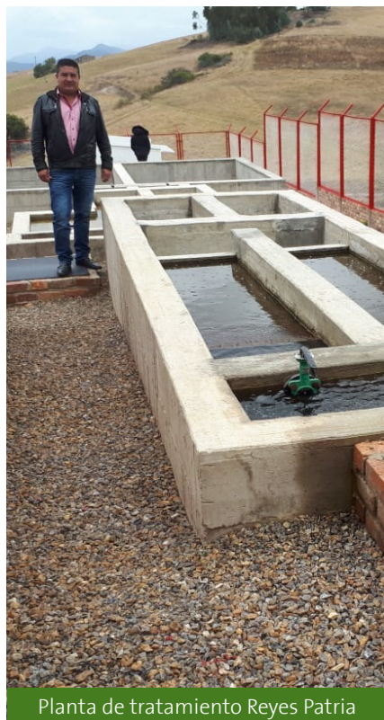
Planta de tratamiento Reyes Patria