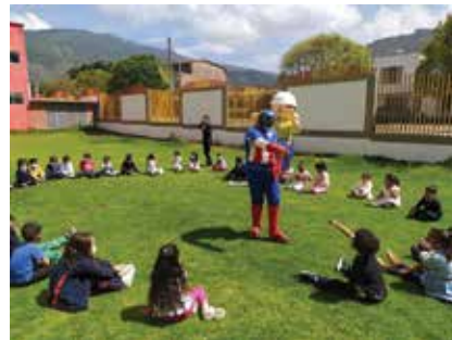
Esta campaña de promoción y prevención se replicó en los municipios de Tibasosa, Iza y Corrales.