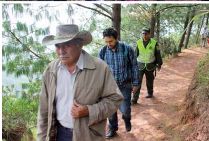
Caminantes visitando tramo de sendero que fue intervenido

« Holcim entrega un sendero para la recreación, el bienestar y el turismo »