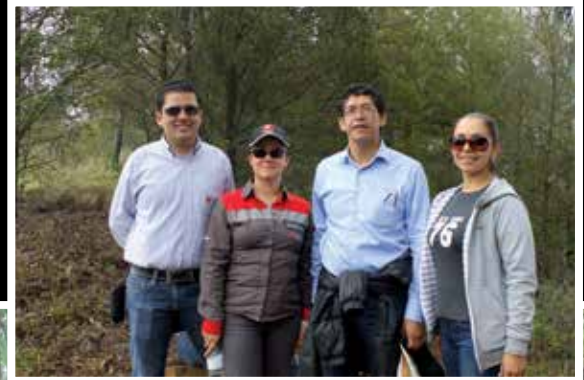
Grupo perteneciente al CAP de Nobsa, autoridades municipales y representantes de FSHC

El objetivo es que se amplíe la intervención de este sendero permitiendo conectar la vereda de Chámeza Mayor y Chámeza Menor con Nobsa, ampliando la extensión del mismo para promover un circuito ecológico y de esparcimiento para la población nobsana y sus visitantes. ↻