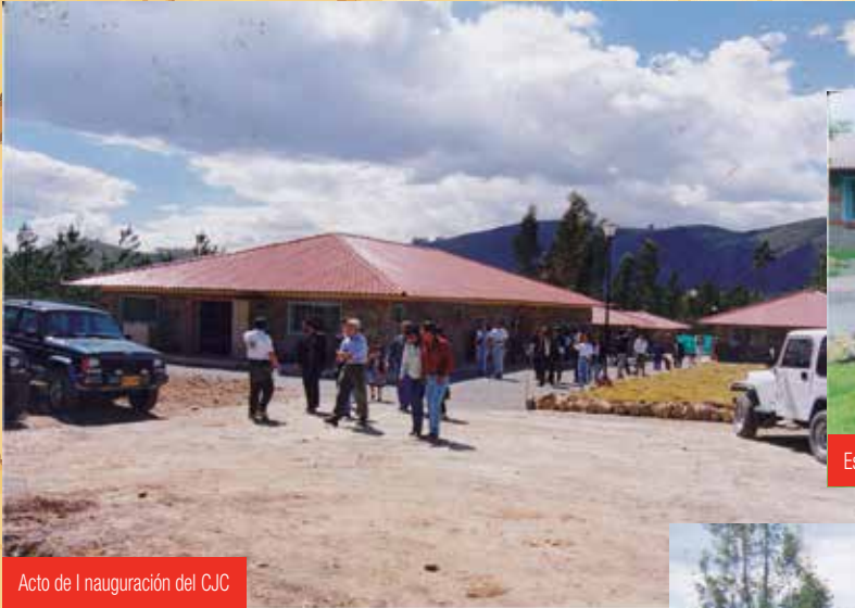
Acto de la inauguración del CJC