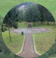
Zona Actividad Recreativa