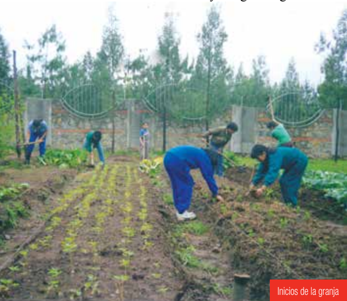
Inicios de la granja