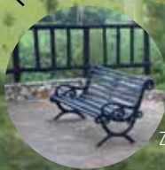
Zona de estar con mobiliario