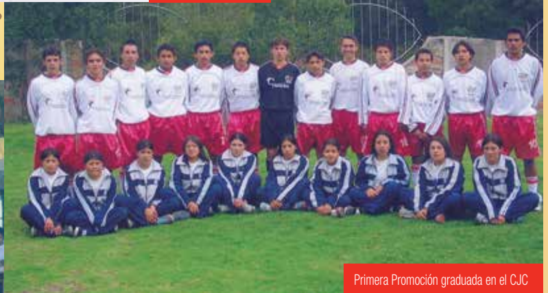
Primera Promoción graduada en el CJC