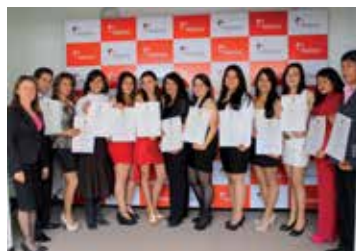
Tecnólogos en Gestión de Recursos Naturales