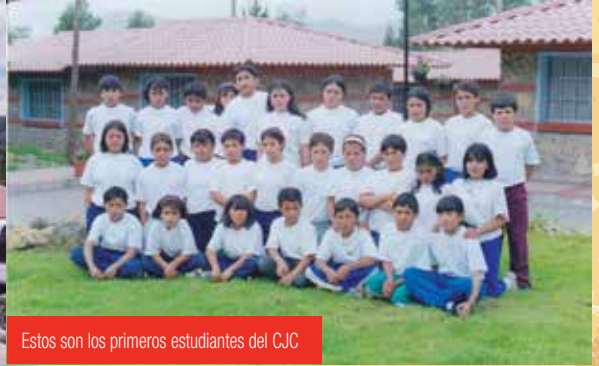
Estos son los primeros estudiantes del CJC