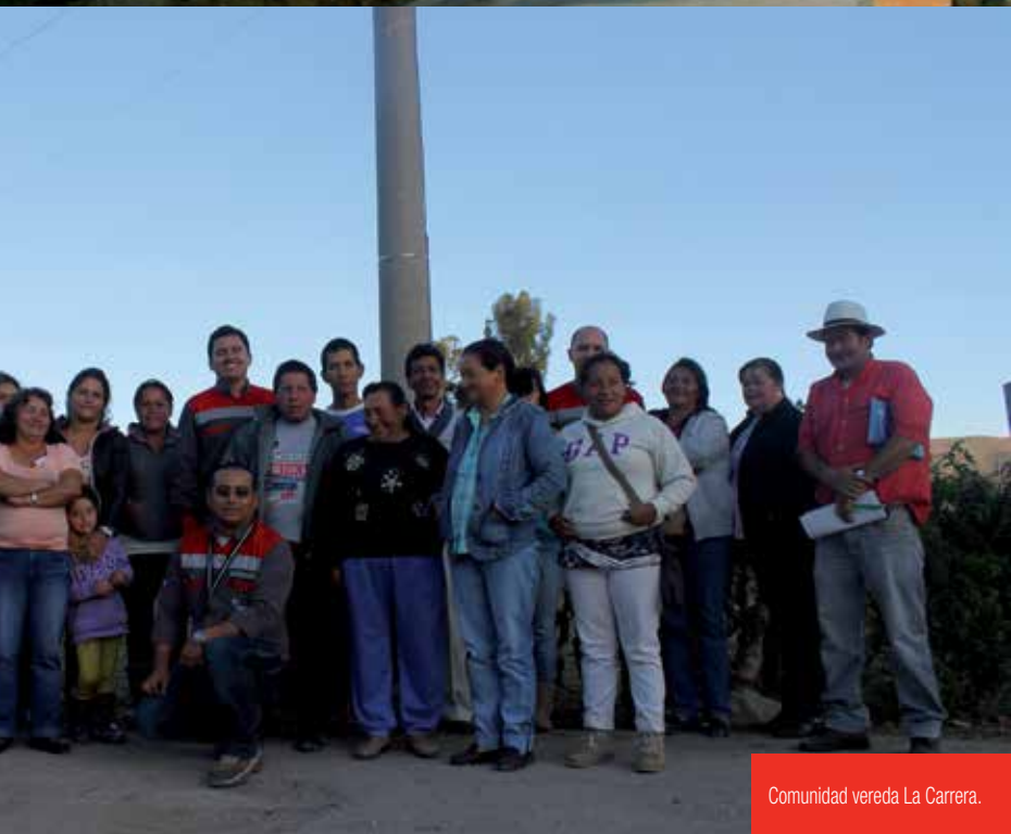
Comunidad vereda La Carrera.

« Voluntariamente nos comprometimos y le cumplimos a las comunidades buscando siempre ser un buen vecino »»