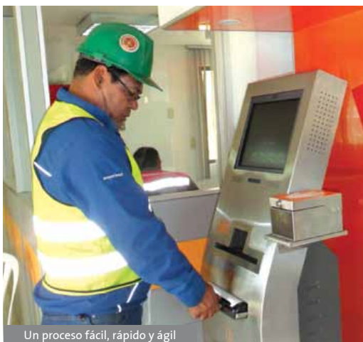
Un proceso fácil, rápido y ágil

D entro del plan de desarrollo de proveedores y con módulos tecnológicos, agendamiento para descargues e inspecciones de ruta, Transcem sigue fortaleciendo su programa de seguridad vial enfocado en la prevención y disminución de la accidentalidad en carreteras, así como el bienestar de los transportistas y conductores. La compañía, filial de Holcim (Colombia) S.A., le apuesta al progreso y al avance tecnológico hacia el futuro del transporte de carga, que cada compañía proveedora vive como un avance en pro de su crecimiento.