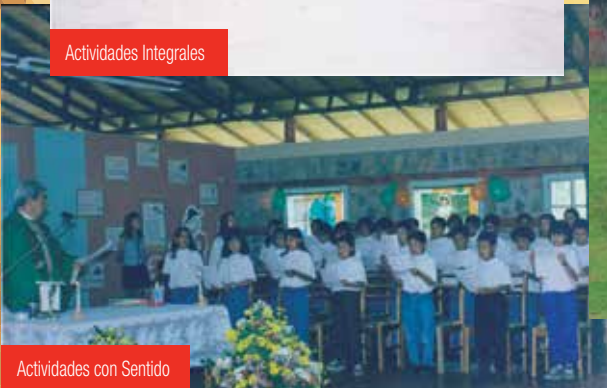
Actividades con Sentido