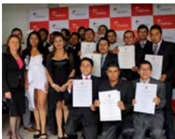
Técnicos en Operación de Equipo Pesado

El auditorio de la Alcaldía Municipal fue el escenario para presentar en sociedad a 36 jóvenes habitantes de las zonas de operación de Holcim en la provincia del Sugamuxi, que recibieron título como Técnicos en Operación de Equipo Pesado (23) y Tecnólogos en Gestión de Recursos Naturales (13), programas que Holcim, en alianza con el Sena Regional Boyacá desarrolla a través de su Fundación Social. A los graduandos les deseamos éxitos profesionales y muchas oportunidades para demostrar el sello que caracteriza a los boyacenses, honestidad y compromiso.