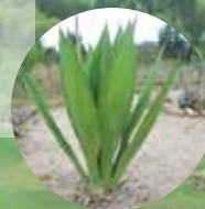
Bosque Seco (Asociación fique, Motua gris, cucharo y choco).

Cientos de personas conocen el Parque de Iza y los vecinos de este lugar lo han hecho un espacio propio que les permite hacer deporte cada día por sus senderos bien cuidados, disfrutar de un festival de cometas en agosto, una tarde de sábado o domingo en familia, o simplemente celebrar una novena de navidad ecológica, acogedora y única.