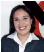
Por: Érica Maldonado, Analista de Proyectos de la Fundación Social de Holcim Colombia

Generar estas oportunidades para los jóvenes de Ciudad Bolívar, es una búsqueda constante de alianzas para mejorar la calidad de la educación, analizando el mercado e identificando sus necesidades se originan los programas de educación técnica que darán nuevas oportunidades para la juventud de la localidad a través de sus convocatorias. Uno de los factores más importantes de los programas es que se fomenta la práctica con oportunidades dentro de diferentes empresas y Holcim (Colombia) S.A.